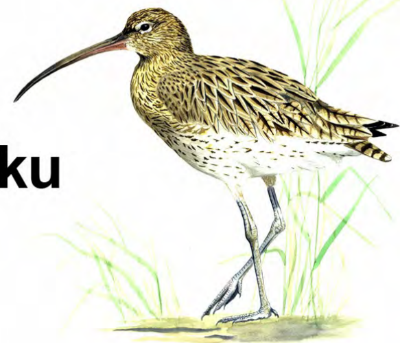
Rys. Marek Kołodziejczyk

Wycieczka terenowa Wszechnica Biebrzańska Mapa miejsce spotkania - 10 grudnia 2017 r.