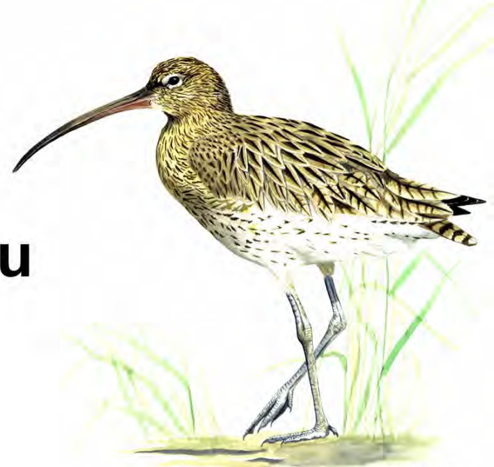
Rys. Marek Kołodziejczyk